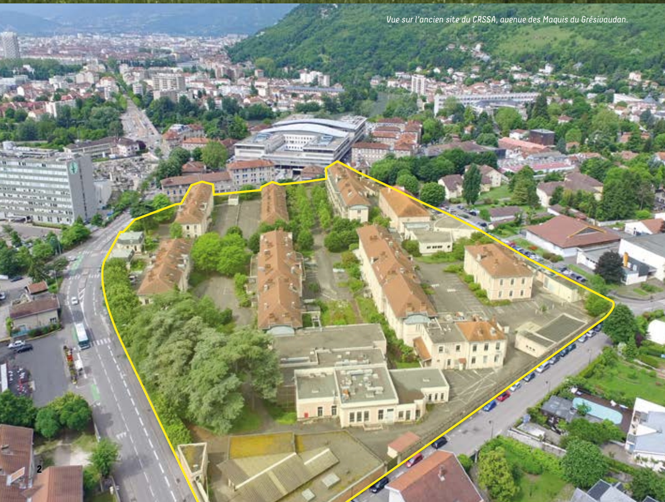
Vue sur l'ancien site du CRSSA, avenue des Maquis du Grésivaudan.