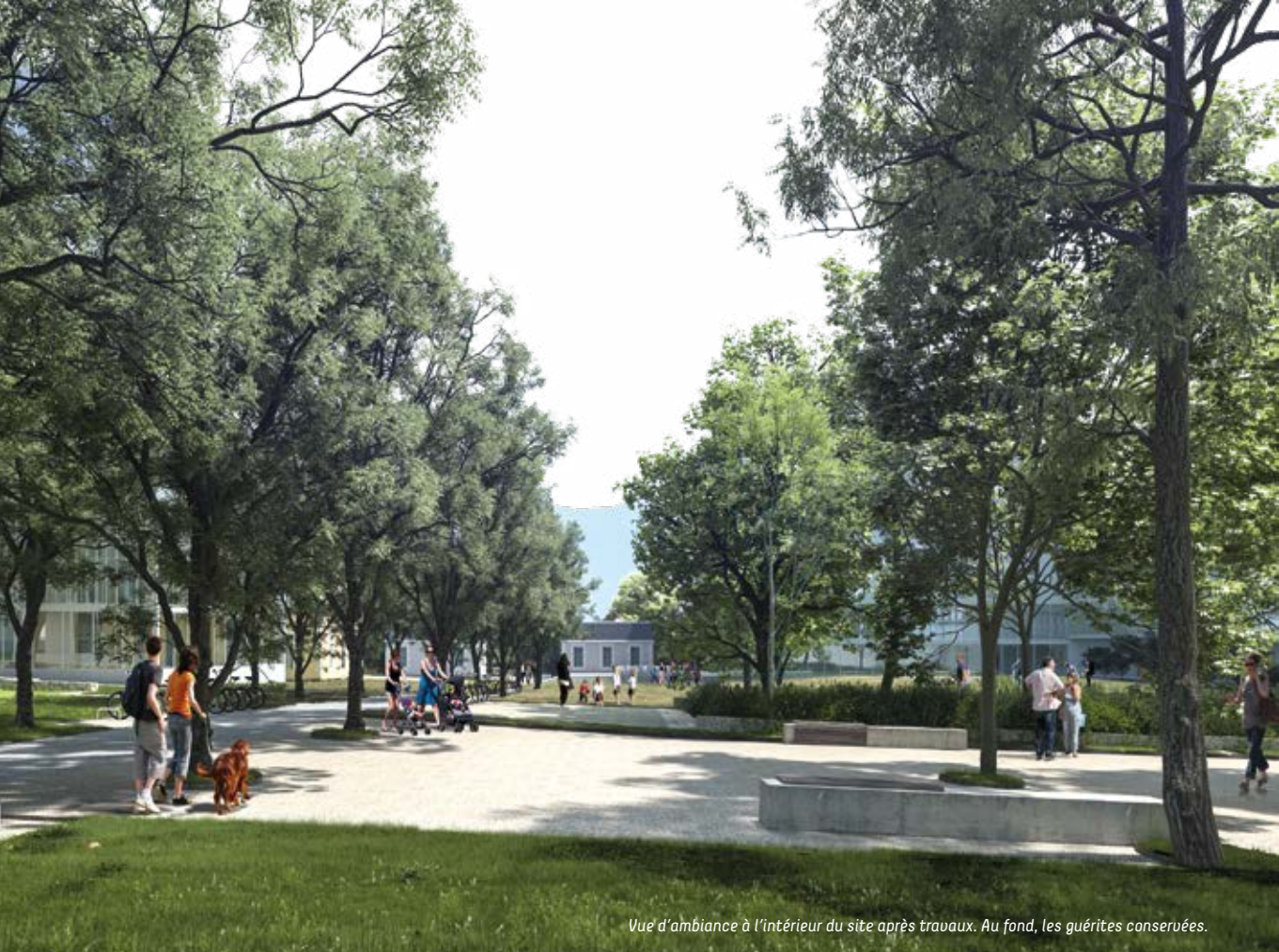
Vue d'ambiance à l'intérieur du site après travaux. Au fond, les guérites conservées.